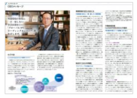
価値創造ストーリー